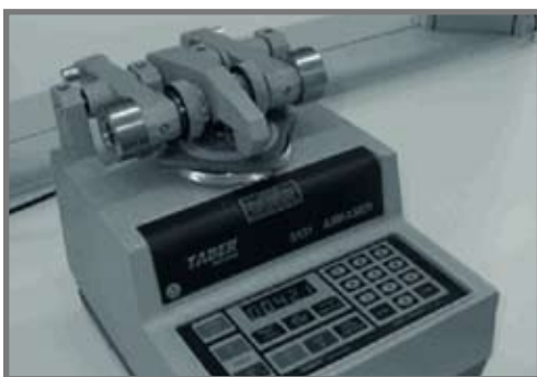
Taber Abraser Instrument

Die tatsächliche Leistung der Abriebfestigkeit hängt von der Farbe, der Oberfläche und dem Bindemittelsystem ab. Bitte beachten Sie, dass diese Testbeschreibung absichtlich allgemein gehalten wurde mit dem Ziel eine Zusammenfassung zu erstellen um das Verständnis für den Test zu verbessern.